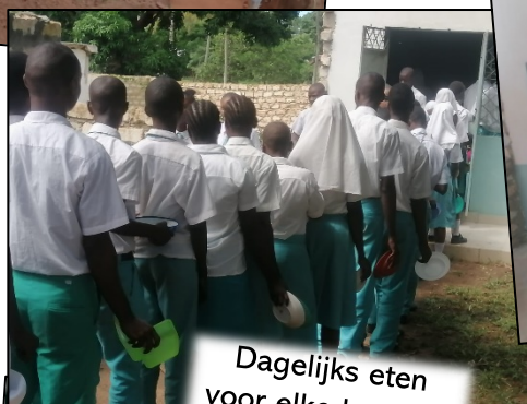
Dagelijks eten voor elke leerling!

Even op een rijtje: wat hebben we allemaal kunnen realiseren sinds de start van het project?