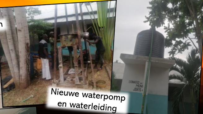
Nieuwe waterpomp en waterleiding