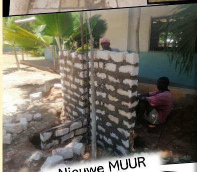
Nieuwe MUUR rond de school